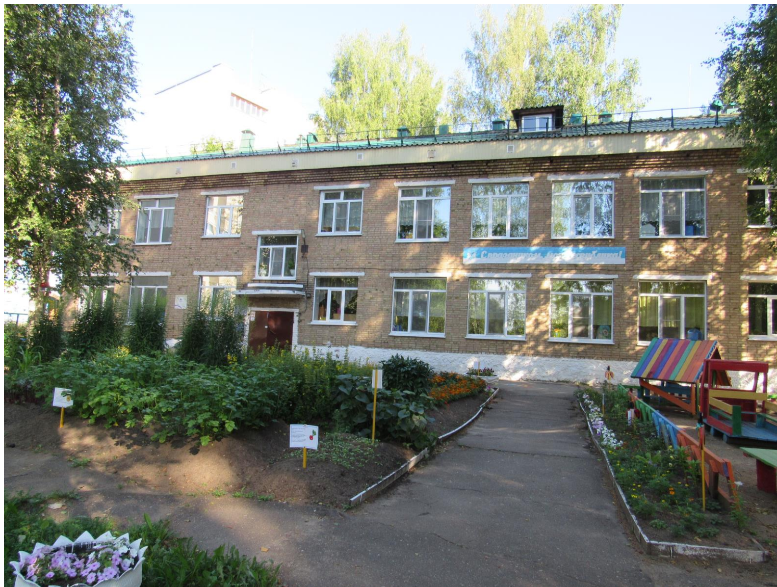
Фото здания по ул. Карла Маркса, 221а